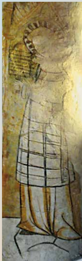
Kirche Bärberg, Laurentius

Kursgebühr: 40 € Unterkunft/Verpflegung: EZ: 150 €, DZ: 138 €