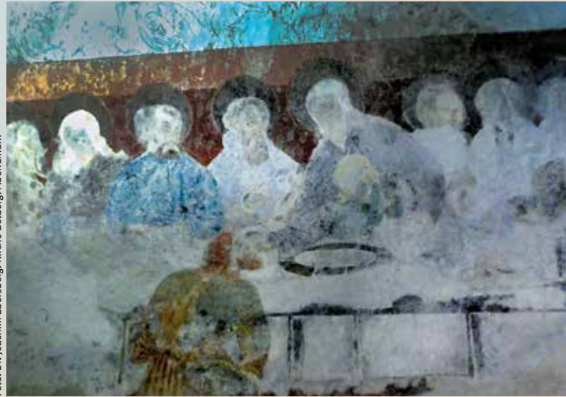
Kirche Betberg-Abendmahl